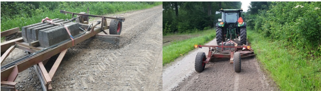
Arbejde på grusvej

I 2026 vil forvaltningen afprøve støvbinder for at mindske spild af materiale og støvgener for naboer på en bred grusrabat (forsøgsstrækning) på Obdrupvej ved Lyngby.