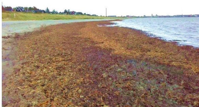
Grenaa Strand med tang

Norddjurs Kommune vil miste Blå Flag-mærkningen og desuden opleve et faldende antal turister, sommerhusgæster og besøgende til kommunen, på grund af strandenes fremtoning og manglen på faciliteter.