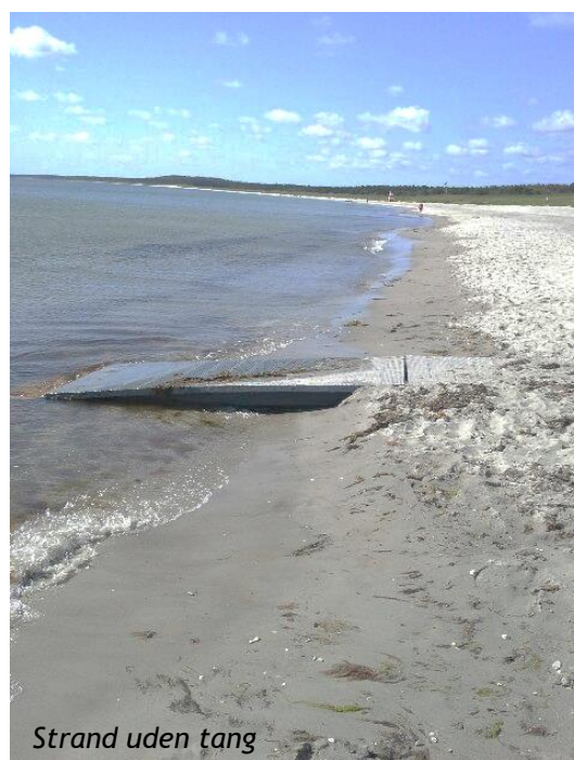
Strand uden tang

Der fjernes rådnende tang på varme sommerdage i ferietiden, for at undgå lugtgener på strandarealer i Grenaa og Fjellerup. På de øvrige Blå Flag-strande fjernes der kun helt undtagelsesvist rådnende tang.