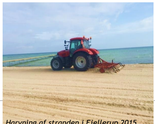
Harvning af stranden i Fjellerup 2015